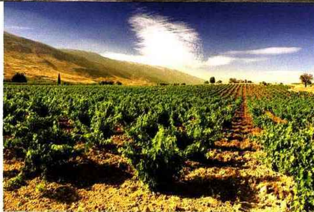
LE LIBAN, PAYS DE VIN www.planetveo.com