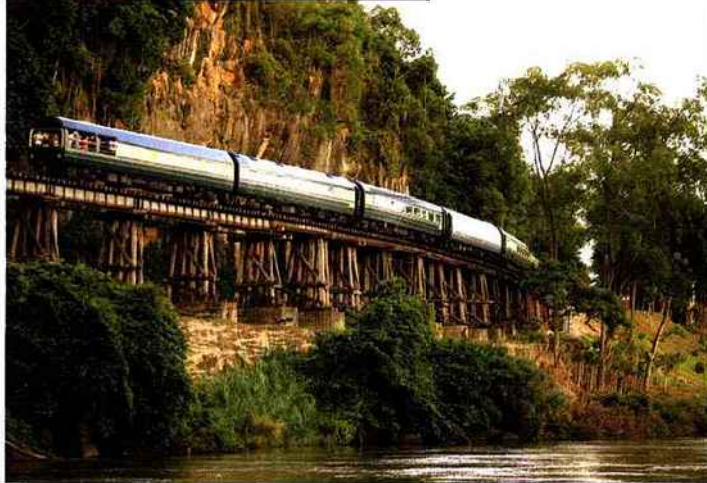
L'EASTERN ET ORIENTAL EXPRESS www.orient-express.com